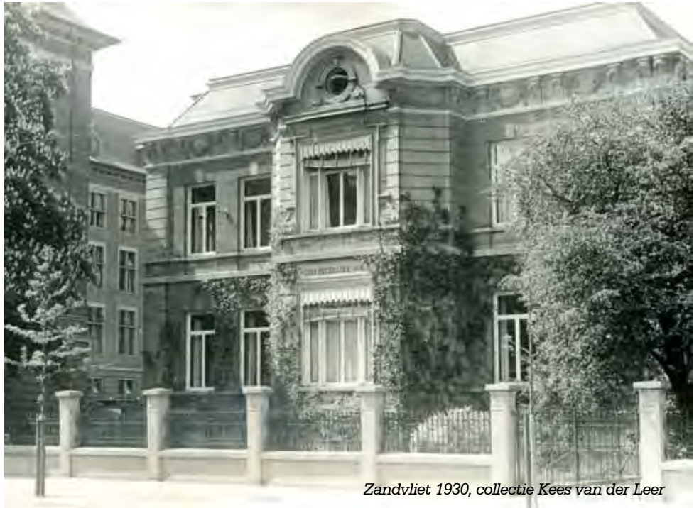
Zandvliet 1930

Voorts gaf de ligging van enkele lokalen, anders dan Henk Evers dit zo mooi beschrijft elders in dit nummer van Z, naast zicht op het Haagse Bos ook uitzicht op de burelen van het ministerie van Economische Zaken. Met grote interesse volgde ik de bezigheden van een aantal ambtenaren, die in mijn beleving de hele dag de krant aan het lezen waren, afge-