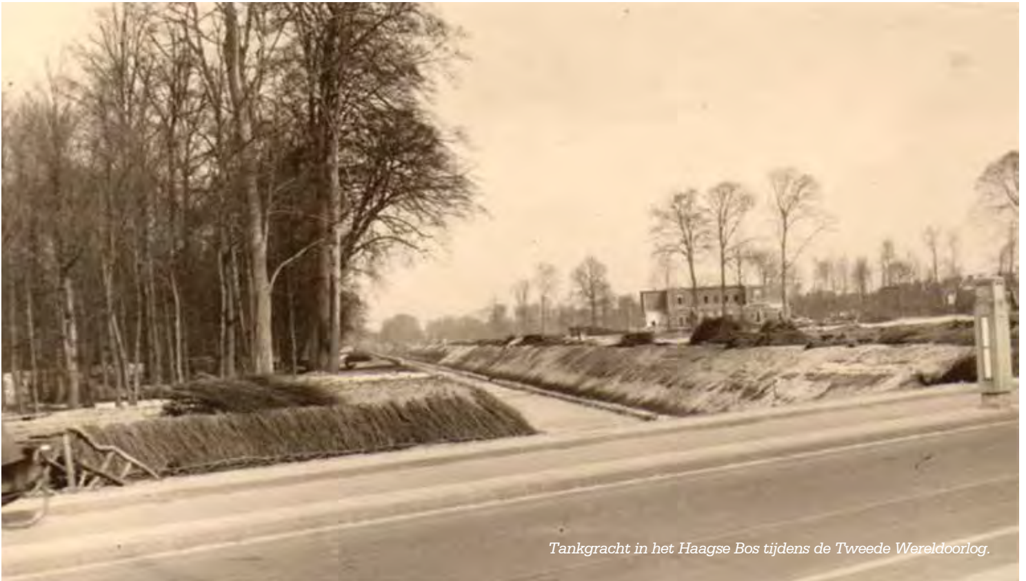
Tankgracht in het Haagse Bos tijdens de Tweede Wereldoorlog.