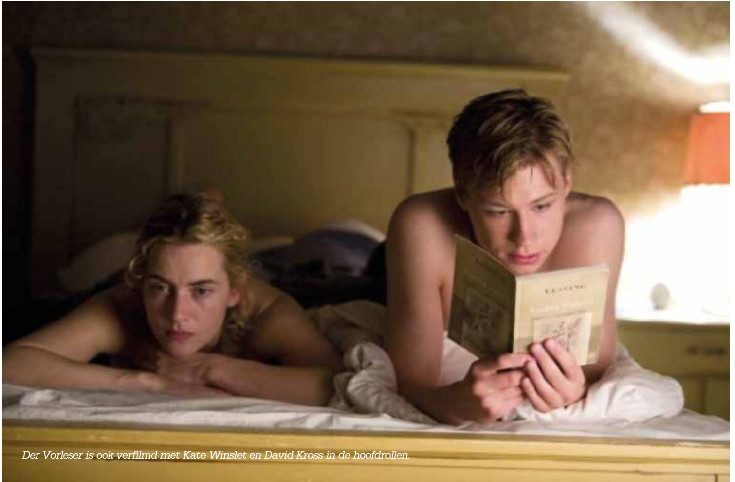
Der Vorleser is ook verfilmd met Kate Winslet en David Kross in de hoofdrollen.

Waarom vroeg Hanna hem altijd, haar voor te lezen uit de wereldliteratuur en waarom koos ze voor een baan als kampbewaakster boven een promotie in een fabriek, waar ze in 1944 werkzaam was? (Het antwoord hierop geef ik heel bewust niet, want als de lezer van mijn verhaal het boek nog niet kent, is de verrassing weg.)