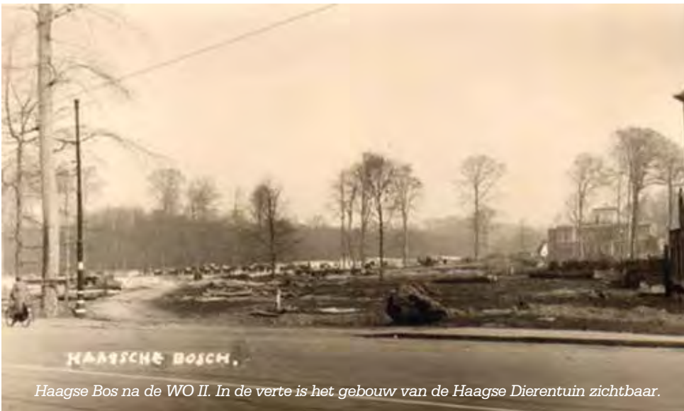
Haagse Bos na de WO II. In de verte is het gebouw van de Haagse Dierentuin zichtbaar.